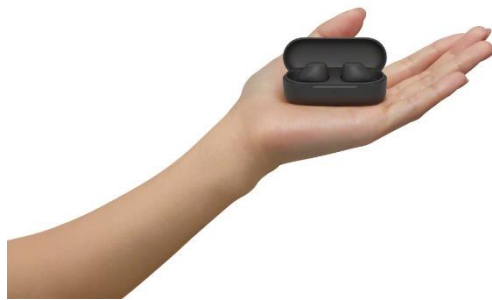
小巧圓柱形充電盒

與之前型號相比，更細小的耳塞使充電盒也相應縮小，小巧的圓柱形充電盒設計更為纖薄，方便放進口袋或手袋內攜帶，成為用戶的隨身耳機。