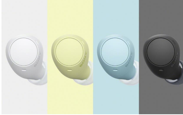
(左至右)WF-C510 備有白色、黃色、藍色及黑色