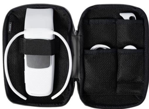
REON POCKET 專用機套

兼容型號：RNP-1A / RNP-2 / RNP-3 / RNP-4/ RNP-5