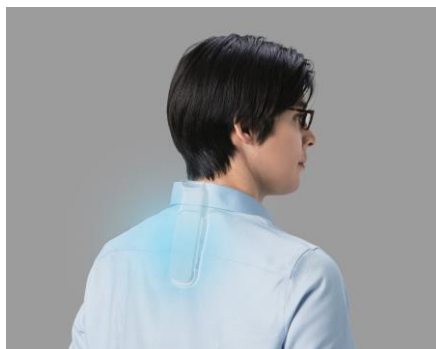
穿戴式冷暖調溫機套裝 RNPk-5T

香港 · 2024 年 4 月 23 日 – Sony Thermo Technology Inc. 今天發佈全新穿戴式冷暖調溫機套裝 REON POCKET 5 。產品為 REON POCKET 系列的第五代型號，戴在頸部直接與身體接觸到的部分可帶來涼快或溫熱的感覺。產品配備全新發熱組件和散熱結構，與傳統型號相比 1 ，使用時間延長 1.8 倍 2 ，降溫效能提高 1.5 倍 3 。此外，還提升自動冷/暖切換功能，靈活配合用戶的活動和環境。