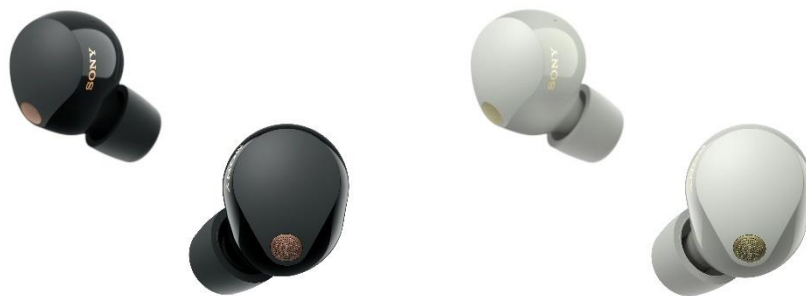
WF-1000XM5 備有黑色及銀白色