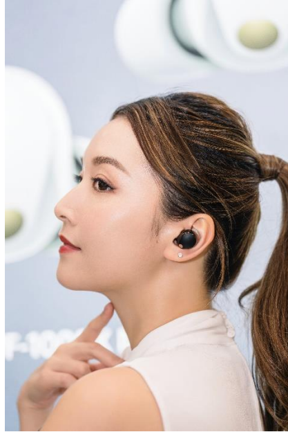
考慮舒適度的設計

噪音隔離耳塞套由獨特的材料製成，不僅增強貼合度，加上全新設計的形狀，通過減少耳朵的壓力提高舒適度。耳塞備有四種不同尺寸，包括超小尺寸 SS ，用戶可選擇最適合自己耳朵的尺寸。