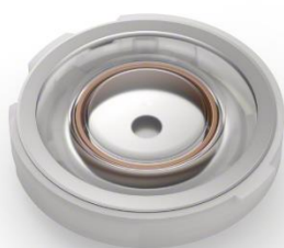
Dynamic Driver X 驅動單元

結合 Sony 最新開發高清降噪處理器 QN2e 和內置 V2 處理器，WF-1000XM5 包含精密 24 位元音頻處理和高效能模擬放大功能，帶來低失真和水晶般清晰的音頻重現。