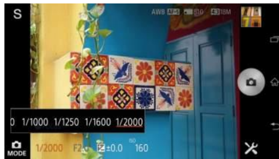
QX100 於“S”模式的ISO 設定