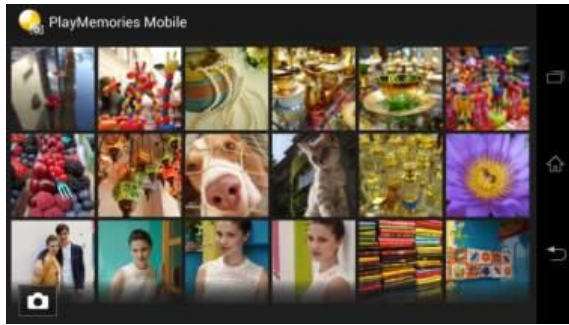
透過應用程式拍攝的照片提供“縮圖預覽”