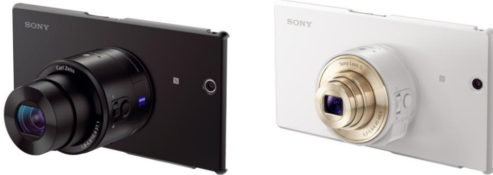
Xperia™ Z Ultra 鏡頭裝配手機套配上 Cyber-shot QX100 及 QX10

Sony 為 Cyber-shot QX 鏡頭型數碼相機推出軟件及韌體更新以提升速度及功能 全新 PlayMemories Mobile™ 應用程式 4.0 版本新增相片瀏覽功能及加快連接速度 新韌體增加全高清影片拍攝功能及擴闊 ISO 感光範圍